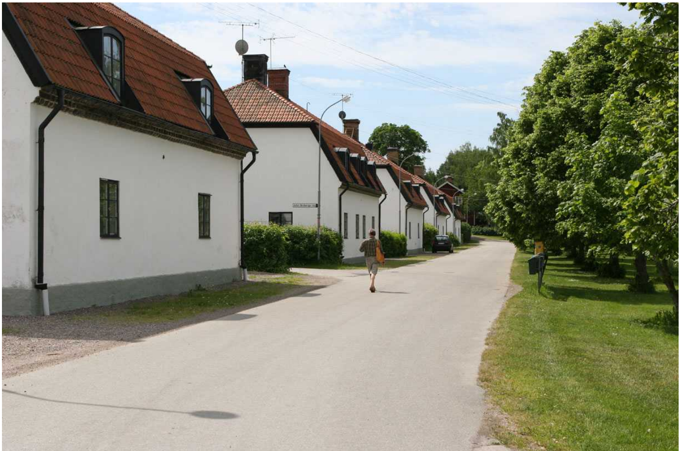
Bruksgata i Strömsberg