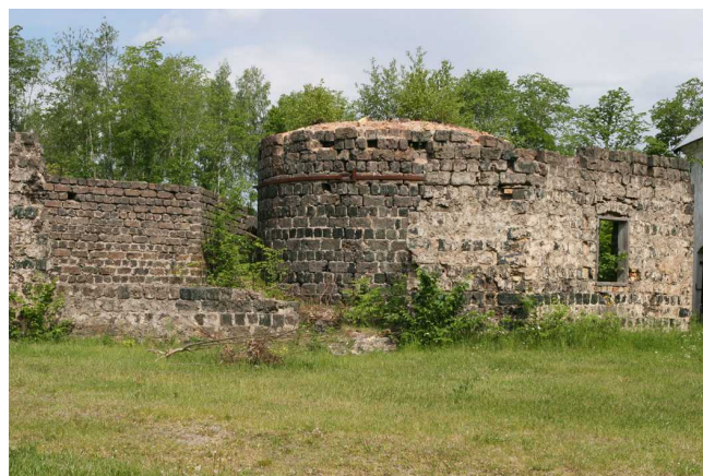
Rostugnen i Strömsberg

Järnmalmen hämtades från Dannemora. Först ”rostades” malmen i rostugnar. Härvid drevs fosfor och vatten ur malmen. Malmen hackades sedan i bitar, ett arbete som ofta utfördes av kvinnor och barn. Därefter vidtog processen i masugnen. Järn och kol smälte samman i den höga värmen, som mest 1450 grader. Som biprodukt fick man slagg som användes som byggsten. Tackorna märktes med uppgift om kolhalten. Tackjärnet smiddes sedan till stångjärn. Vallonsmidet pågick ända in på 1900-talet.