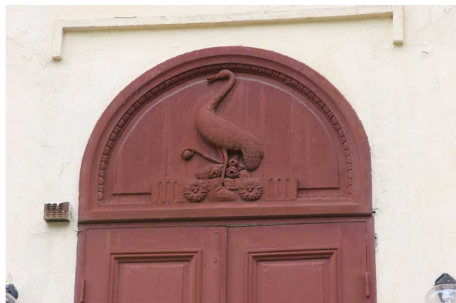
Grillska vapnet på naturaliekabinettet i Söderfors

Enligt traditionen härstammar slakten från den italienska adelsslakten Grillo. De hade en trana med en syrsa i näbben som sitt släktvapen (syrsa heter grillo på italienska). Familjen Grill hade också en trana i sitt borgerliga vapen. Det har emellertid inte gått att verifiera traditionen. Det man vet är att det har funnits hantverkare i Augsburg i början av 1400-talet som har burit namnet.