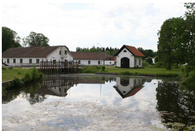
Dammen i Strömsberg

Strömsbergs bruk i Tolfta socken är sk riksintresse enligt miljöbalken. Länsstyrelsen i Uppsala län motiverar riksintresset enligt följande: ”Upplands enda järnbruk där alla komponenter som bildade en typisk bruksmiljö finns bevarade.” Som uttryck för riksintresset anges: ”Masugn, rostugnar och kolhus, smedja, kvarn och sågverk vid dammen, arbetarbostäder, herrgårdsanläggning och stora ekonomibyggnader för jordbruket m m från 1700- och 1800-talen.”