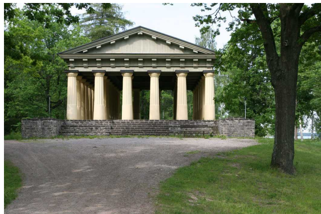
Templet i den engelska parken

Liksom flera andra bruk, t ex Lövsta, var ambitionerna höga på Söderfors vad gäller konst och vetenskap. De samlingar som byggdes upp i naturaliekabinettet på Söderfors har senare överförts till naturhistoriska riksmuseet i Stockholm.