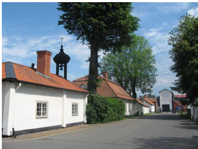
Bruksgatan i Söderfors

Söderfors bruk i Söderfors socken är s k riksintresse enligt miljöbalken. Länsstyrelsen i Uppsala län motiverar riksintresset enligt följande: ”Arkitektur- och industrihistoriskt intressant samt påkostad bruksmiljö med rätvinklig plan av likartad karaktär som vid vallonbruken och enhetlig bebyggelse från i huvudsak 1700-talet.” Som uttryck för riksintresset anges: ”Bruksgator med arbetarbostäder, kyrka, herrgårdsanläggning, ekonomibyggnader för jordbruket, äldre industribyggnader samt modernt stålverk som delvis inrymts i industribyggnader från 1800-talet. Engelsk 1700-talspark, med bl a grekiskt tempel.”