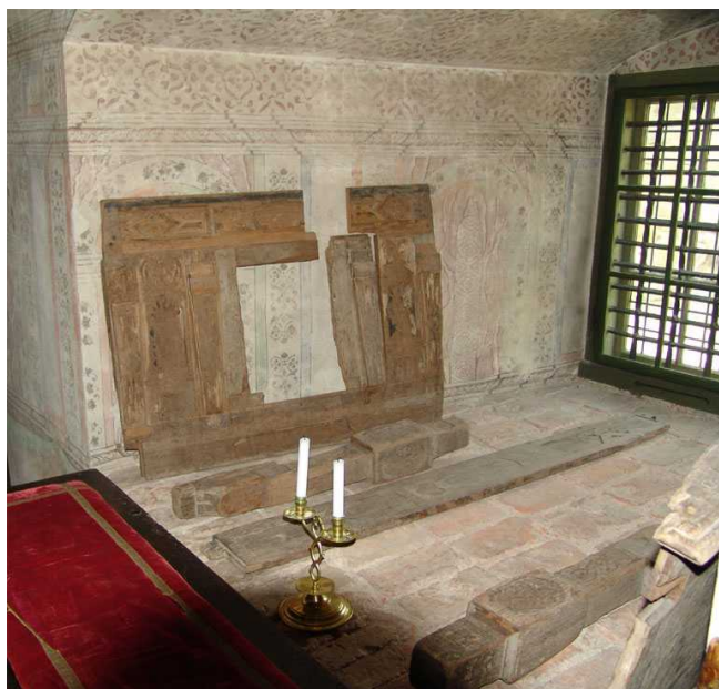
Erik XIV:s sänggavlar på Örbyhus

Principen var att den äldste sonen skulle ärva kronan. När Gustav Vasa avled 1560 kom således Erik att överta tronen. Den nye kungen var högt bildad och hade stor intelligens. Men han var instabil. Han kunde lätt brusa upp och i vredesmod begå oöverlagda handlingar. Detta drag fanns både hos hans far Gustav och hos farfadern Erik Johansson. I Eriks fall kom den sjukliga misstänksamhet som också Gustav Vasa hade att kraftigt förstärkas och periodvis övergå i en förvrängd verklighetsuppfattning.