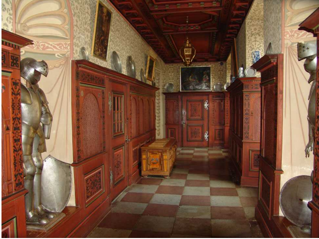
Den mäktiga hallen i bottenvåningen i vasastil

Erik XIV lär ha dött i detta rum. I en fönstersmyg står lämningar av hans säng, gavlar med inläggningar. På väggen sitter en porfyrtavla med inskription på latin i översättning: