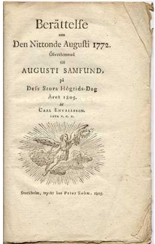
Envallssons skrift om statsvälvningen

Sådan Kung Är värd at styra Sveriges öden: Rask och ung, Ej rådlös uti nöden. : || : Wasa Ätt Har aldrig lärt att svika, Aldrig tvika Men at fika Till at göra rätt. : || :