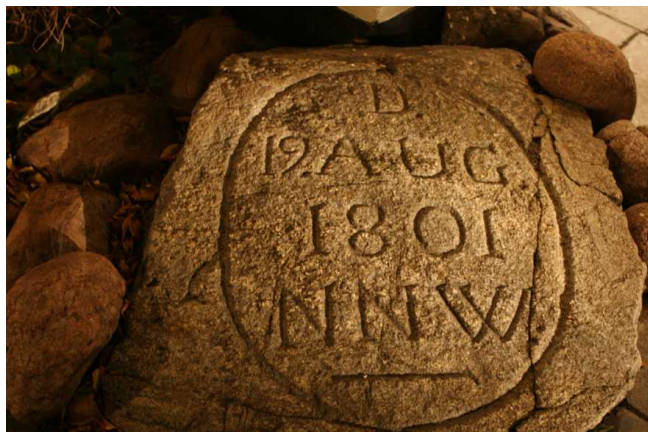
Ristning vid Stallmästargården i Stockholm