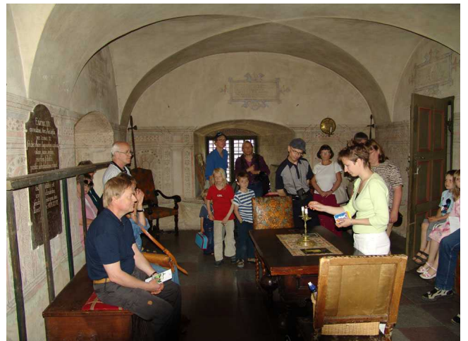
I Örbyhus fängelsehåla

december 1317 i fängelsehålan där de senare avled. Kungen kunde dock inte dra nytta av sitt svek utan fördrevs från riket i samband med ett uppror 1318.