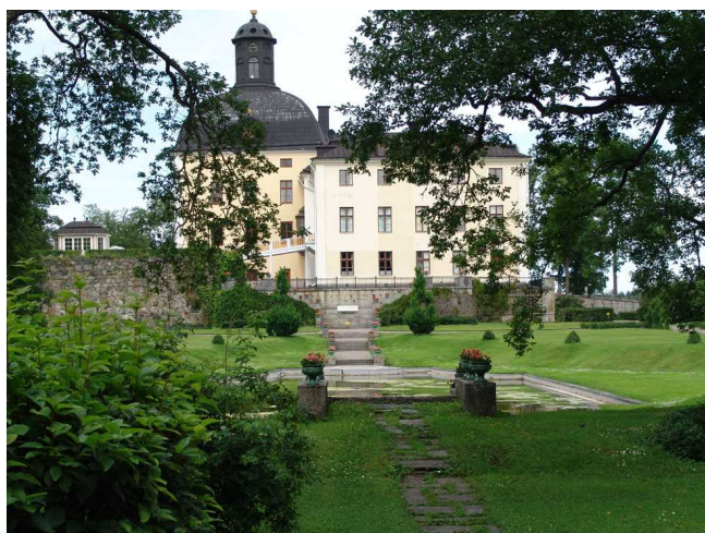
Vy av slottskomplexet från barockparken

Gustav Vasa bytte till sig borgen av sina kusiner 1548. Han byggde vallar och utvecklade borgen till en fästning. Han byggde en ca 16 m hög skansmur, "gråmuren". Muren byggdes utåt i fyrkant och inåt rundad med två runda bastioner. Här fanns stora utrymmen för manskap och förråd av materiel. Fästningen kom dock aldrig att användas för försvarsändamål. Däremot användes den som statsfängelse. För fångenskapen av Erik XIV iordningställdes en våning med flera rum i bottenvåningen i det medeltida tornet.