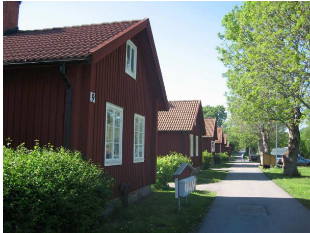
Karholmsbruk, bruksgata med upprustade smedsbostäder

vattenturbin, ångmaskin och vällugn. Järnproduktionen ökade kraftigt. Lancashiremetoden, hämtad från Lancashire i England, innebar att samma produkter togs fram som tidigare, men med mindre åtgång av kol. I samband med 1930-talets kris lades järntillverkningen ner 1931.