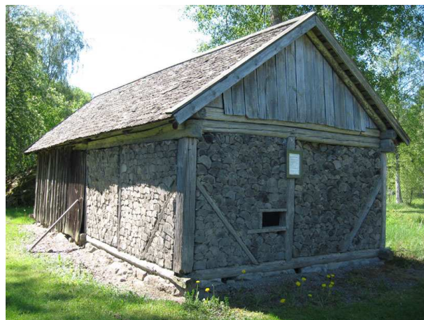
Edvalla hembygdsgård, "Knubbladugård" med väggar av tvärställd träkubb och lerklining

Edvalla hembygdsgård invigdes 1954 och är ett resultat av fantastiska insatser av ideellt arbete av ortsbefolkningen. Ett 20-tal äldre byggnader från Hållnashalvön har flyttats till hembygdsgården.