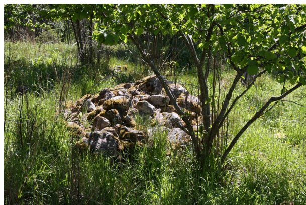
Vikingatida grav vid Lingnåre

Förutom korn som man gjorde gröt eller tunnbröd av samt kött och mjölk från kreaturen behövde gårdens befolkning ytterligare tillskott av livsmedel. Det fick man i någon mån genom jakt i skogarna i söder. Viktigare var dock fiske i insjöarna och det närliggande havet samt sälfångst. Säl-fångsten gav också tran som bl a kunde användas vid skinnbearbetning, som bindemedel för färg samt för belysning. Jakt på sjöfågel och insamling av ägg kan också ha betytt en del.