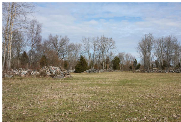
Det gamla åkerlandskapet med odlingsrösen vid Lingnåre

järnförekomster. Man tillverkade visserligen det mesta på gården, men vissa saker, däribland järn, var man tvungen att införskaffa utifrån.