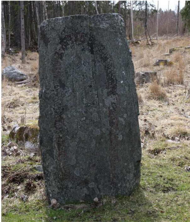
Runstenen vid Lingnåre