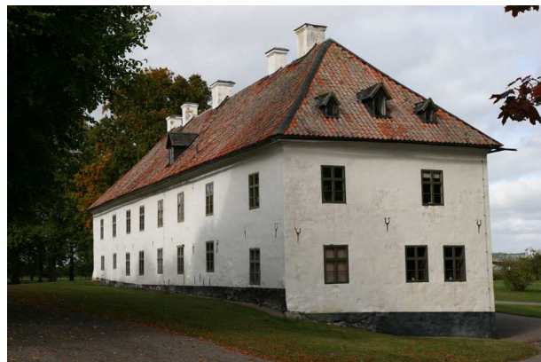
Stenhuset vid Skokloster

Namnet Skokloster ger besked om att det här tidigare funnits ett kloster. En liten bit från själva slottet ligger Stenhuset som delvis har medeltida byggnadsdelar, till del stammande från det cistercienserkloster för nunnor, som anlades här under senare delen av 1200-talet. Nunnorna från Småland hade erbjudits ny mark på Skohalvön, och uppförde här ett kloster med en kyrka i tegel. Klostret hade vida besittningar (bland annat ägde man mark i Tensta socken i Vattholma!). Klostrets byggnader omfattade flera längor runt ett atrium, och med byggnader även utanför klostermurarna. En av dessa byggnader var det hus där de gästande kanikerna bodde, dvs präster från Uppsala, som kom för att låta bikta nunnorna.