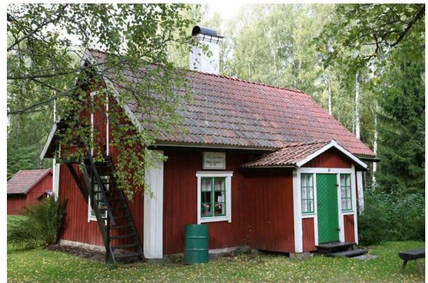
Soldattorpet Flasta nr 48

på 1850-talet. Kanske för att synas bättre mot de numera allt oftare rödfärgade husen?