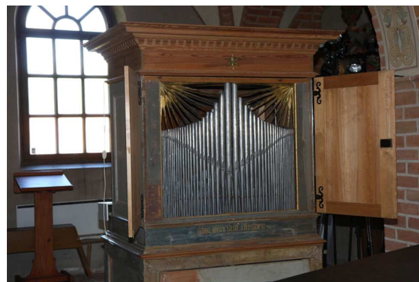
Fältorgeln i Skokloster kyrka

Holmger Knutsson, son till kung Knut Långe, är begravd i kyrkans kor och betraktades som ett helgon. Han var ledare för de s k äkta folkkungarna och var motståndare till Birger Jarl och kung Erik Eriksson. Efter ett uppror mot Erik Eriksson blev han avrättad år 1248. Ett gravkläde för hans grav broderades på 1400-talet, delvis av nunnorna i Sko. Klädet har funnits i Sko kyrka men finns nu på Statens Historiska museum.