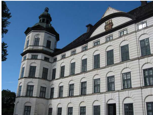
Skoklosters slott, fasaden mot Mälaren

Stuck görs av en blandning av limvatten, gips och med inslag av hår från nötkreatur. Det senare hjälper till att hålla massan på plats även då figurer modelleras fram. Det stora rum som delar den wrangelska våningen i två hälfter kallades den alldagliga matsalen. Särskilt alldaglig i ordets betydelse för oss är nu inte detta imponerande rum. Särskilt inte med det stuckaturtak som här möter oss besökare. Ur en stor drakes mun i salens mitt sprutar eldslågan i form av den äldsta ännu bevarade svensktillverkade glaskronan. Tyvärr lider denna vid Kungsholmens glasbruk tillverkade krona av glassjukan, en åkomma som beror på att glasmassan fått felaktiga proportioner. Sjukan gör att kronan sakta men säkert krackelerar från insidan och ut, en process som inte går att hejda.