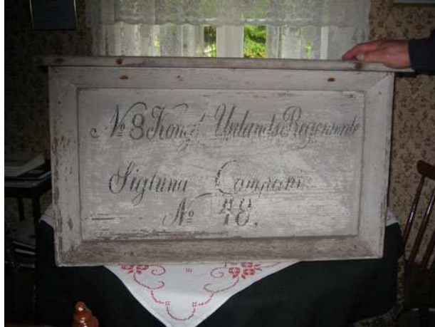
Soldattavla för Flasta nr 48

Fönsterrutorna var små och fogades samman med blyspröjsar på 1700-talet. På 1800-talet blev rutorna större till följd av utvecklad teknik. Blyinfattningen ersattes av träspröjs och kitt. Först under sent 1800-tal kom lösa innanfönster i bruk, vilket betydde mycket för värmeisoleringen.