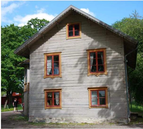
Ett av de vackra husen vid Sandbro