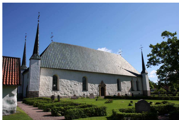
Björklinge kyrka från söder

I samband med anläggandet av en busshållplats utmed gamla E4 strax söder om Björklinge kyrka påträffades en kyrkogård. Troligen föregicks den medeltida stenkyrkan av en träkyrka vars läge med all sannolikhet var intill denna kyrkogård.