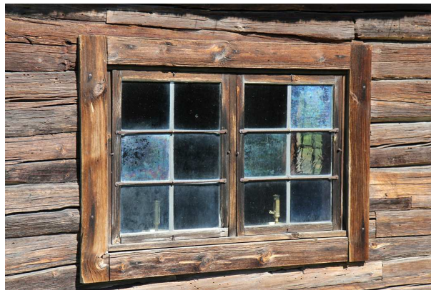
Fönster på boningshuset

stugan på andra sidan. Anderstugan fungerade som feststuga. Den användes inte och stod kall i vardagslag. Vardagsstugan och kammaren användes således till alla vardagens funktioner – äta, arbeta och sova. Loftet var oinrett och kallt. Fönstren är små och blyspröjsade.