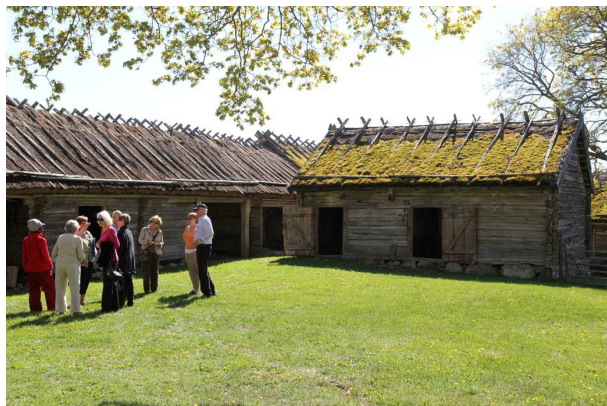
Ekonomibyggnader på Kvekgården