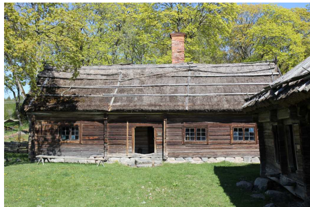
Boningshuset på Kvekgården

Bygatan har ursprungligt läge. Dessa byggnader uppfördes under perioden från slutet av 1700-talet till mitten av 1800-talet. Byggnaderna står alla på stengrund och är uppförda i timmer som ej klätts in med panel. Byggnaderna är omålade och har med åren antagit en brungrå ton. Taken är täckta av halm. Gården är en av länets bäst bevarade ålderdomliga gårdar och har därför förklarats som byggnadsminne.