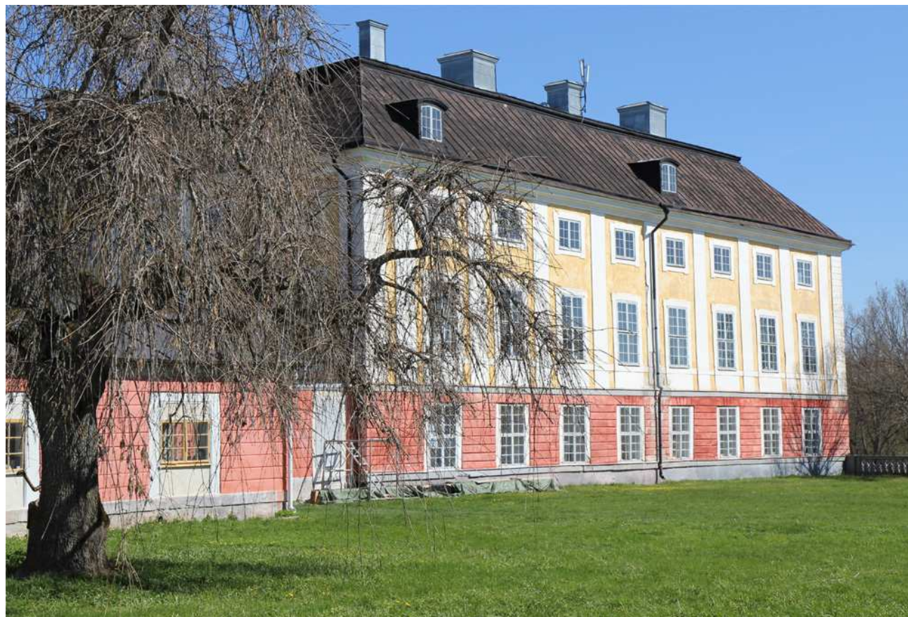
Ekolsunds slott, norra flygeln

Samuel av Ugglas var en av den gustavianska regimens dugligaste ämbetsmän samt skicklig brukspatron på Forsmark. I samband med mordet på Axel von Fersen 1810 kom pöbeln även att rikta sin vrede mot af Ugglas vars hus i Stockholm med knapp nöd undgick att stormas.