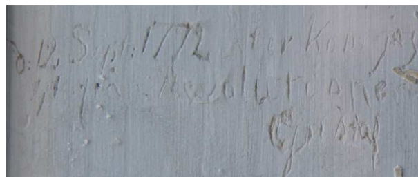
Gustaf III:s anteckning i fönstersmygen

År 1683 övergick slottet i Kronans ägo genom reduktion. Genom faddergåva blev slottet tronföljaren Gustavs egendom 1747. Gustav III hade stora ombyggnadsplaner som ej genomfördes. Han ville göra slottet dubbelt så stort och det skulle också innehålla en teater. Under hans tid skedde en upprustning av slottets interiörer. Ansvariga var ett par av dåtidens mest kända arkitekter Carl Fredrik Adelcrantz och Jean Eric Rehn. Slottets kanske vackraste rum, Fågelsalen, skapades under Gustav III:s tid. Efter det att Gustav III genomfört sin statsvälvning den 19 augusti 1772 reste han till Ekolsund där han ristade in en anteckning i en fönstersmyg: "d: 12 Sept: 1772 återkom jag hit från revolutionen Gustaf".