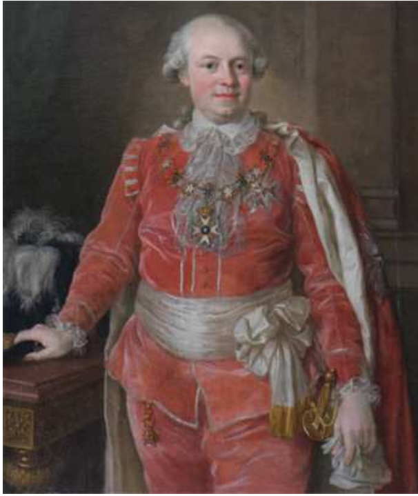
Samuel af Ugglas

Karl August hade dött en naturlig död av slaganfall vid Kvidinge hed. Men det kom snart att utspridas ett rykte om att han hade blivit förgiftad. Särskilt aktiv i ryktesspridningen var en av den nya regimens män, Karl August Grevesmöhlen. Ryktena pekade ut den framstående gustavianen, riksmarskalken Axel von Fersen, och hans syster Sofie Piper som dem som legat bakom giftmordet. Under begravningsprocessionen den 20 juni 1810 färdades von Fersen i en vagn närmast före kistan och blev i Gamla stan angripen av en rasande folkhop och under ett utdraget förlopp lynchad. Mordet på Axel von Fersen är en av de större skandalerna i svensk historia. Under hela förloppet stod stridsberedda trupper redo, men ingrep inte till hans försvar.