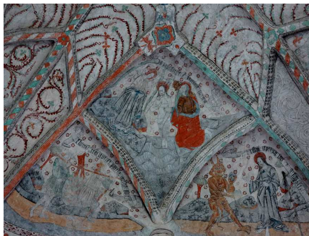
Tätt mellan bilderna i Rasbokils kyrka

sets östra valv möter vi den gammaltestamentliga berättelsen om de tre männen i den brinnande ugnen. I korvalvet finns bilder av de fyra apostlarna och bilder av Jesu föregångare i Gamla testamentet, t.ex. Simson. På väggarna finns invigningskors. Inför invigningar av kyrkobyggnader skulle biskopen ha fastat. Vid invigningen, som var en omfattande procedur, skulle han bl.a. stående på en steg med pek- och långfinger teckna kors med helig olja på tolv stälten på kyrkväggarna.