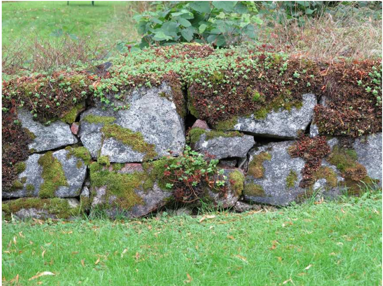
Kyrkogårdsmuren vid Rasbo kyrka

Romantikens Uppsala under 1810- och 20-talen dominerades av ett antal framstående akademiker och författare av vilka Erik Gustaf Geijer och Per Daniel Amadeus Atterbom var de främsta. Kring dem förekom ett intensivt sällskapsliv i de litterära salongernas och soaréernas tecken. Genom Malla Silfverstolpes memoarer vet vi mycket både om uppsala-romantikerna och om det liv de levde; en gången tid träder levande emot oss.