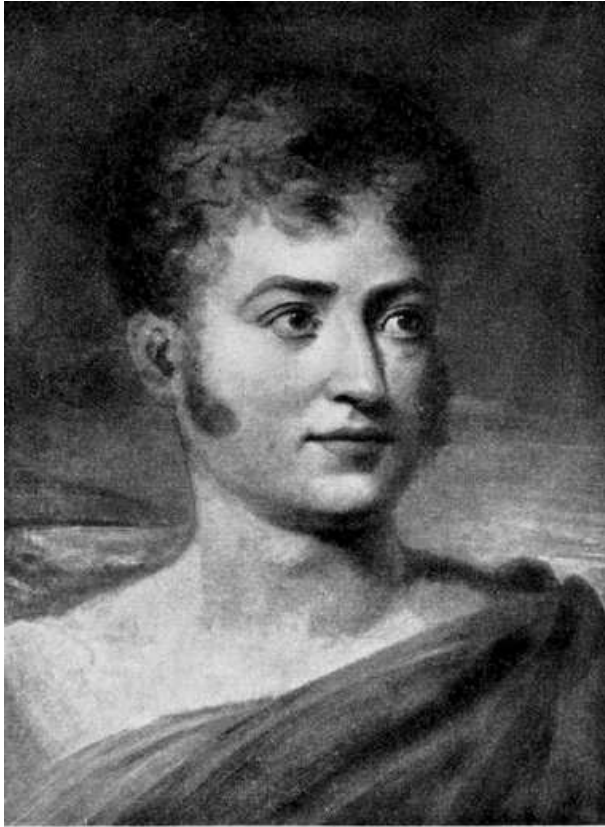
Per Daniel Amadeus Atterbom