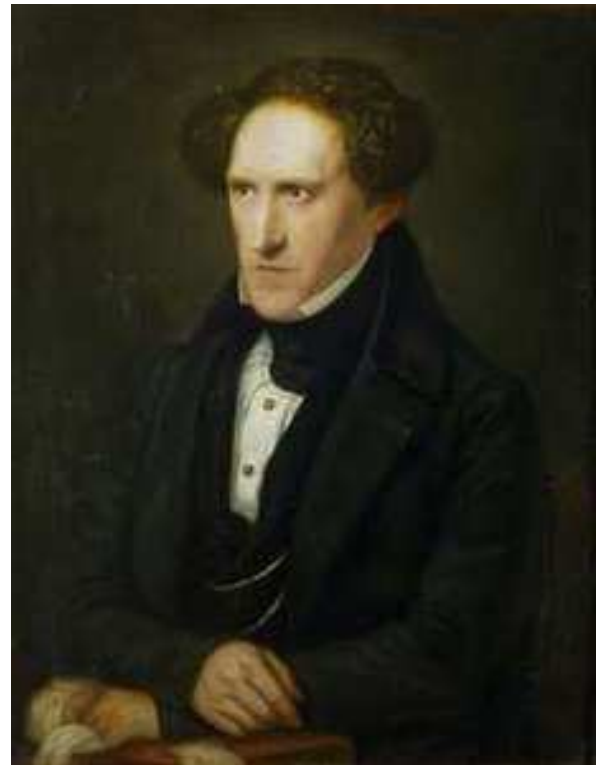
Carl Jonas Love Almqvist