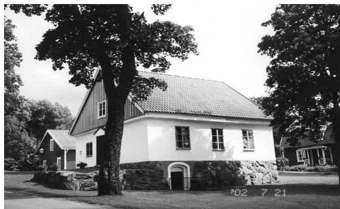
Vitskolan, uppfördes 1754. Skolverksamheten upphörde 1781. Huset blev skola för andra gången 1914-1966.

1875 uppfördes en småskola i Fassma . För att avlasta Kyrkskolan etablerades också en skola vid Bräcksta 1876. Denna upphörde dock fr.o.m. hösten 1888 när den nya Kyrkskolan stod klar.