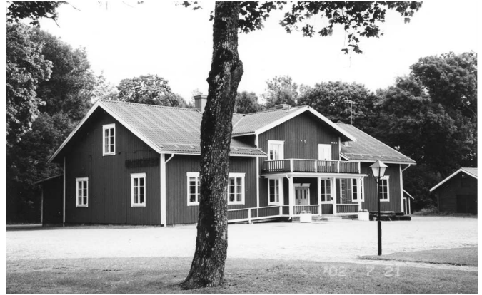
Kyrkskolan stod färdig 1888 till en kostnad av 6090 kr

När den upprustade Kyrkskolan åter togs i bruk 1834 tillsattes en skoldirektion med uppgift att utarbeta en utförlig instruktion för skolan. Av instruktionen framgår bl.a. att undervisning skulle bedrivas i "Bokstafvering och innanläsning af Modersmålet, med både svensk och Latinsk stil, - Christendoms-kunskap efter den antagne catechesen, - Biblisk Historia, - Räkna och Skrifva, samt de första grunderna i Choral-Sång." Skolgången var ännu inte obligatorisk men hade barnen anmälts till skolgång kunde föräldrarna inte godtyckligt ta barnen ur skolan. Enligt folkskolestadgans föreskrifter beslöt man 1843 att alla barn som undervisades i hemmen av sina föräldrar skulle komma till Kyrkskolan varannan lördag för förhör för att visa att deras kunskaper motsvarade undervisningen i den fasta skolan.