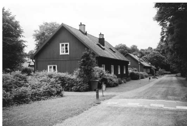
Husen och träden formar ett vackert gaturum

Rivningen av de sämsta äldre byggnaderna skedde våren 1974. Rivningarna utfördes manuellt och under överinseende av länssantikvarien. Den befintliga bebyggelsen uppustades och ersattes i vissa fall av helt nya byggnader. De återuppförda husen utformades så långt möjligt som kopior av de äldre rivna husen vad gäller yttermått, taklutning, fasadutformning och material.