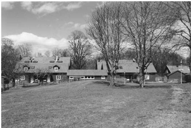
Husen ligger runt ett gemensamt grönområde

Men det är inte bara husens utformning som är viktig vid bevarande. Alla delar av miljön bör ägnas samma omsorg. Man bestämde att vägarna skulle behålla karaktären av smala grusvägar. Man bevarade befintliga träd på den gemensamma gården. Man valde belysning som skulle passa in i den känsliga miljön. Trekanten bevarades som festplats.